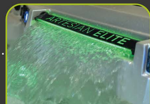
1 LED WASSERFALL