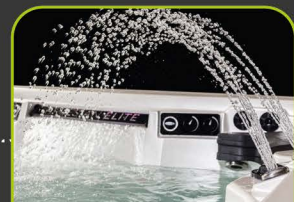
4 LED FONTAINEN