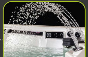
4 LED FONTAINEN