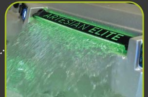
1 LED WASSERFALL