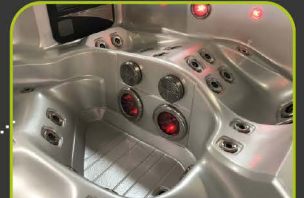
2 LED FOOTBLASTER™