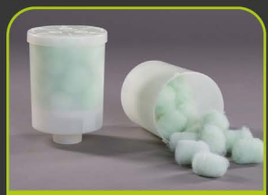
EGO 3 FILTERSYSTEM