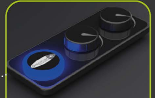
5 DIRECT FLOW™