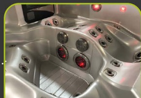
2 LED FOOTBLASTER™