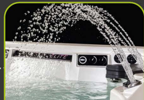
4 LED FONTAINEN