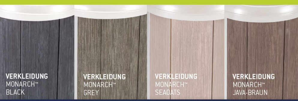
VERKLEIDUNG MONARCH™ BLACK