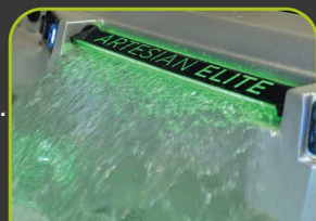
1 LED WASSERFALL