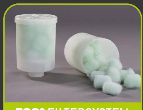
EGO 3 FILTERSYSTEM