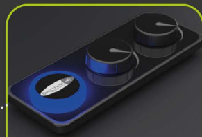
4 DIRECT FLOW™